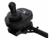
2231 / 2232